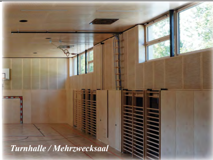
Turnhalle / Mehrzwecksaal