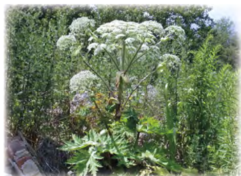
Heracleum mantegazzianum .

Tiroler Bildungsforum. Aber auch für unsere Gesundheit stellen einige Pflanzen eine Gefahr dar. Der Riesenbärenklau ( Heracleum mantegazzianum ) kann bei Berührung zu einer starken Verätzung der Haut führen. Und der Pollen des Beifußblättrigen Traubenkrauts ( Ambrosia artemisiifolia ) ruft starke allergische Reaktionen hervor und das nicht nur bei von Heuschnupfen geplagten