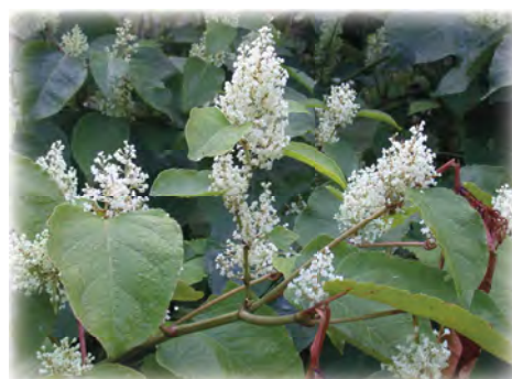
Fallopia x bohemica .