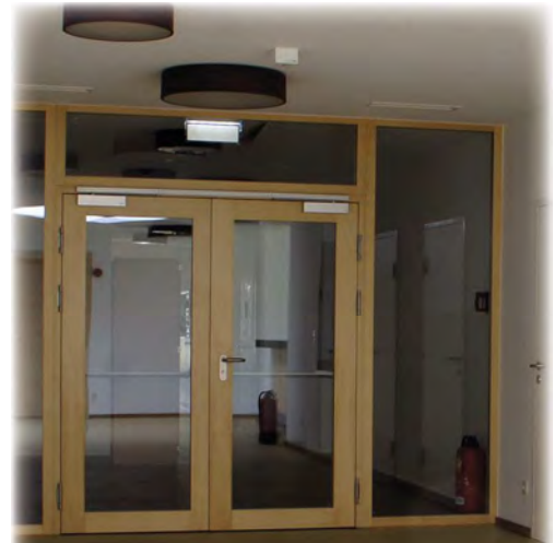
Übergang zur Schule