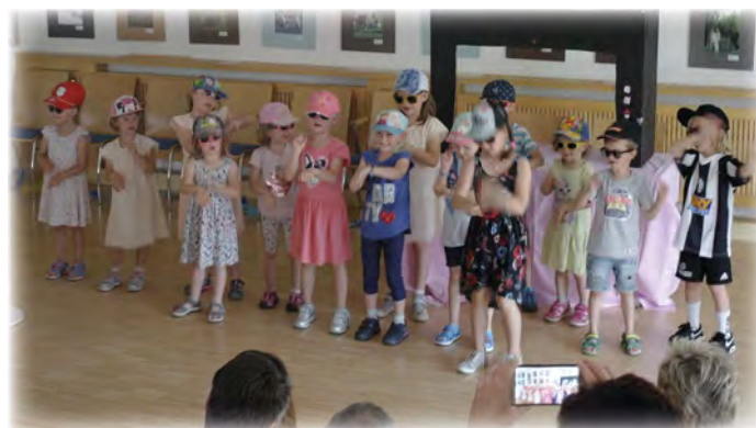
Kinder singen „Hulapalu“ bei der Kindershow.