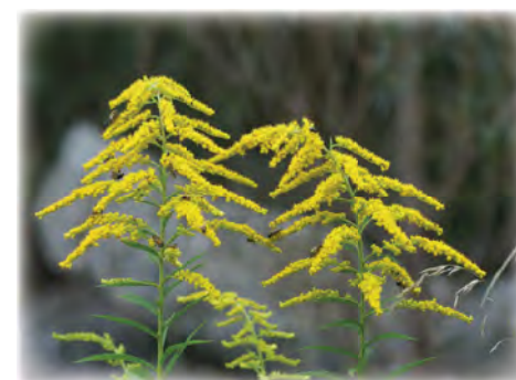
Solidago canadensis .