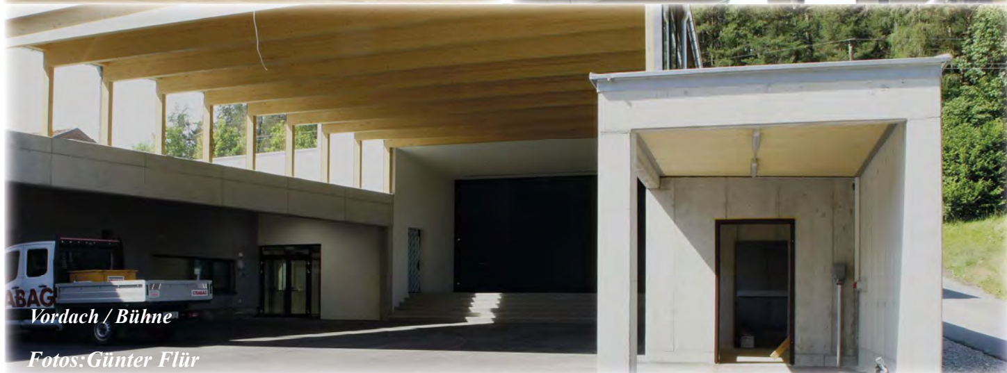
Vordach / Bühne