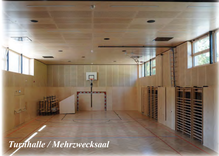
Turnhalle / Mehrzwecksaal