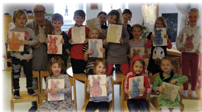
Basteltal mit Rebecca.