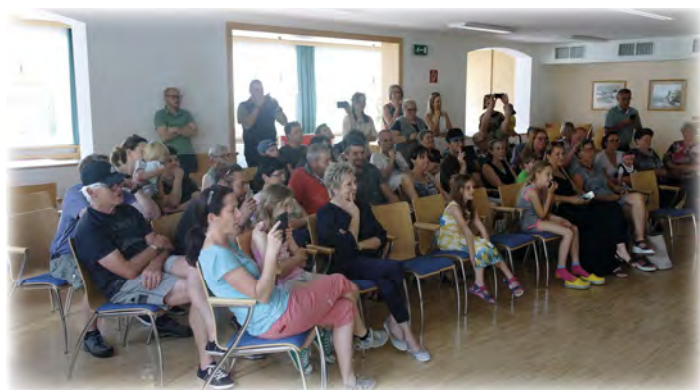
Unsere Besucher beim Familienfest.