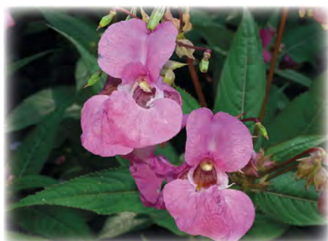
Impatiens glandulifera .

Auch aus wirtschaftlicher Sicht macht das Entfernen invasiver Neophyten durchaus Sinn. „Pflanzen wie das Drüsige Springkraut oder der Staudenknöterich sind in der Forstwirtschaft nicht zu unterschätzende Unkräuter, da sie junge Bäume einfach überwuchern“, so Matthias Karadar, Projektleiter von Natur im Garten und Neophytenexperte im